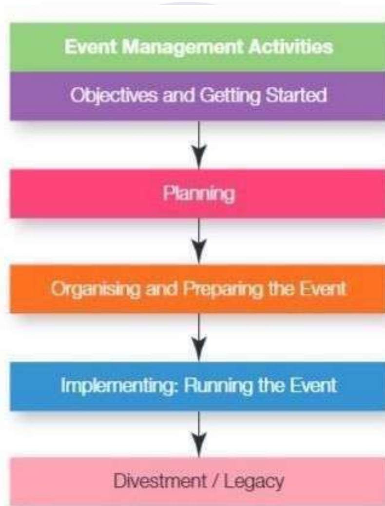
Gambar 2. 2 Tahapan Event Management

Menurut Shone & Parry (2019), terdapat tahap-tahap krusial dalam event management untuk menyelenggarakan acara, hal ini karena adanya tahap proses planning yang membutuhkan cukup waktu. Dalam memastikan suatu acara berhasil, sangat dibutuhkan perencanaan yang detail (Shone, Anton & Parry, 2019). Berikut terdapat lima tahapan pada event management :