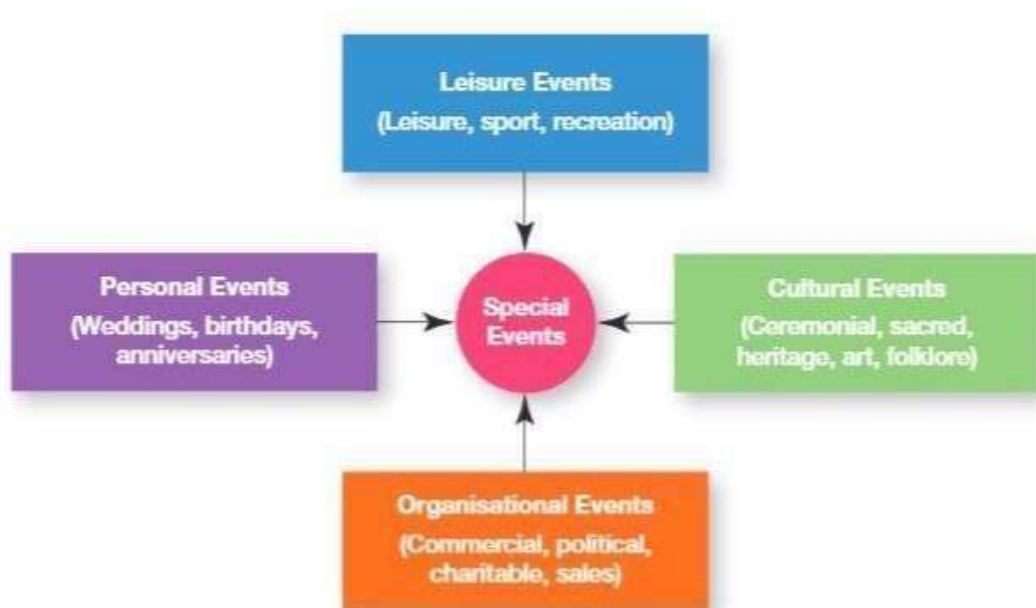
Gambar 2. 1 Kategori Special Event